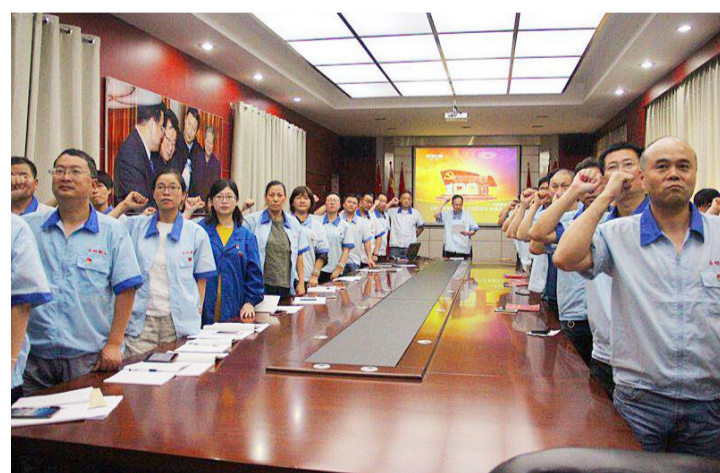
7月13日，由古越龙山酒厂党总支牵头，四个支部联合开展“佩带党徽表决心，铭记历程寻初心”主题党日活动。通过缴一次党费、表一次决心，戴一次党徽、开展一次困难慰问、听一次党史故事的“五个一”系列活动，让每位共产党员度过了一次有仪式感的组织生活。