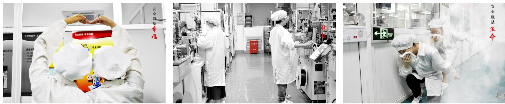
作品标题：《幸福·效益·生命》 作者单位：浙江古越龙山电子科技发展有限公司 作者姓名：鲍阳 内容说明：这一组照片取材于龙山电子产线区域的场景，展现员工阅读安全宣传挂画、日常安全生产和模拟逃生演练三个场景。安全先行，平安相随，有一种“幸福”，叫做安全；安全生产更是“效益”的保障和基石；企业的生产与发展，员工的安康与福祉——这一切，都起于安全这条“生命”的红线！安全是什么？安全是“幸福”所托，是“效益”所依，更是“生命”所系！这，就是我们所理解的安全之美。