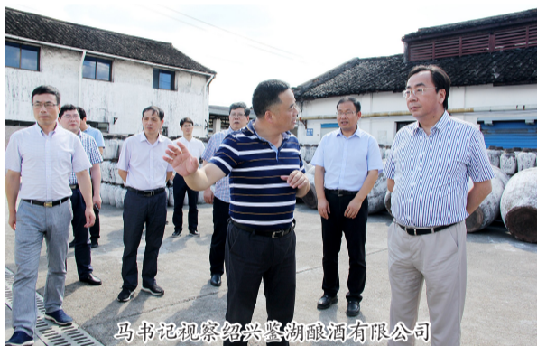
马书记视察绍兴鉴湖酿酒有限公司