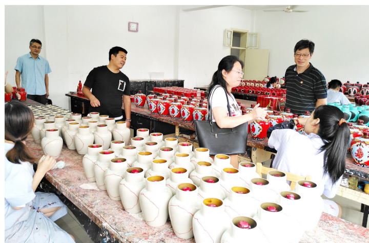
7月3日，市聋哑学校党支部到访工艺浮雕酒分公司，对就业聋哑生开展回访交流活动，了解他们的工作、生活、薪资等情况。今年是工艺浮雕酒分公司与绍兴市聋哑学校校企合作合作的第7个年头，目前共有17名聋哑生就业。