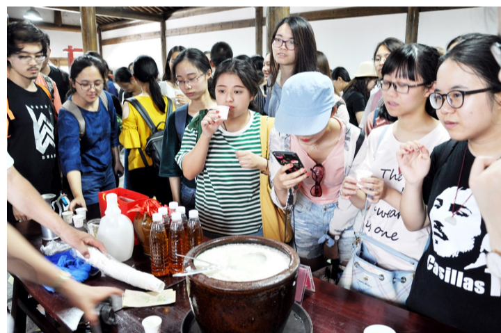
7月16日，浙江大学管理学院2016级财务管理、会计专业60余名学生赴古越龙山，开展为期一天的暑期社会实践活动，了解黄酒悠久的历史与精妙的酿制技艺，以及传承千年的黄酒文化。活动中，公司人力资源部、财务部、营销部相关负责人与同学们展开座谈交流。