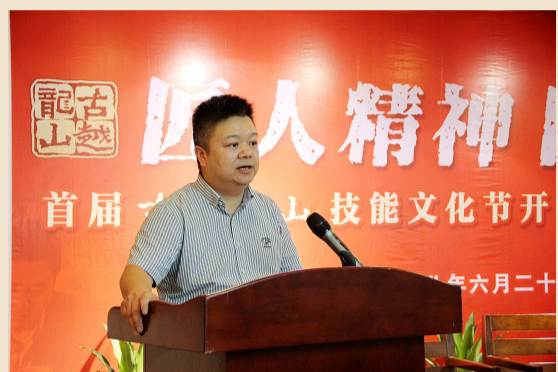
市人力资源和社会保障局副局长 陈朝晖致辞