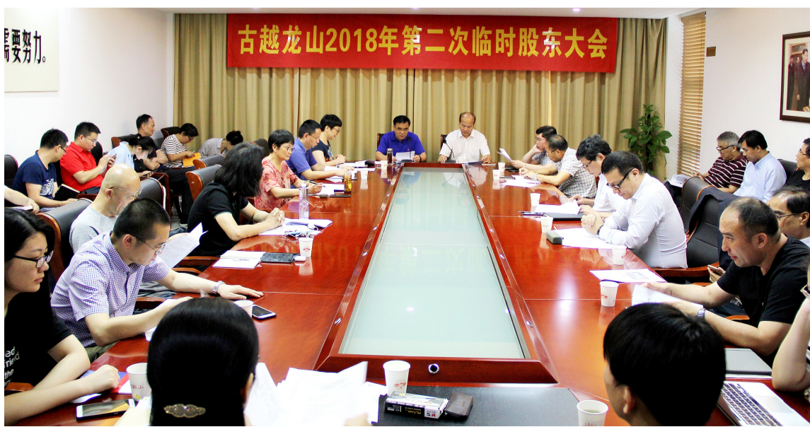
古越龙山2018年第二次临时股东大会