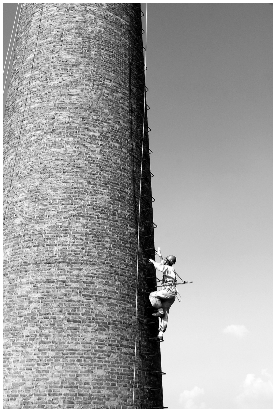
作品标题：《攀》 作者单位：浙江古越龙山绍兴酒股份有限公司生产部 作者姓名：高路 内容说明：此照片拍摄于沈永和酒厂锅炉烟囱避雷针维修时期。 安全生产永无止境。任何一次管理和作业的小小失误都有可能使员工濒临危险的状态，甚至危及生命。希望古越龙山的安全员也能像照片里的维修员一样，勇攀安全高峰，为实现“零”事故目标而努力。

平与业务能力和自保能力。加强安全宣传，警钟长鸣。各生产厂区在显要或特殊位置悬挂条幅、警示标语，安全生产牢记心中。在宣传橱窗设“安全生产”专栏，张贴安全工作方面的法律法规和资料，供职工阅读了解。聘请专家为职工上安全生产讲座，通过做试卷、辩论等多种形式深化安全意识。利用车间黑板报，宣传在安全工作方面的小发明小创造，对能改善安全生产的想法给予表彰和鼓励，做到人人参与，人人有责，安全生产长抓不懈。严格遵守公司的安全规章制度。安全规章制度不是束缚我们的绳索，而是指引我们正确前进的路标。车间员工一定要穿戴好劳保防护用品，在操作工程中要做到互相不伤害的原则，对于工作现场发现不安全隐患要及时上报领导并第一时间解决问题，确保安全工作万无一失。重视生产班组安全，是企业良好运行的保障。班组是企业生产的基本构成单元，班组长要时刻绷紧安全这根弦。班长每天早上提前交接班，到车间查看机械设施是否运转正常，流水线是否满足生产需要，尤其进入夏季，车间工作环境的温度可达四十多度，一定要提前做好防暑降温工作，改善工作环境，做好后勤工作。在“以人为本”、“安全第一”达成共识的大环境下，安全是一种对个人、对企业负责的态度，是企业的生存之本。只有人人绷紧“安全”这根弦，把安全放在首位，企业才能健康、持久地发展。(巴音花/销售公司)