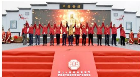
14家绍兴黄酒企业代表携手宣誓“做诚实人，酿良心酒”

11月7日上午9时，第24届绍兴黄酒节暨首届中国(国际)黄酒产业博览会开幕式在中国绍兴城国际会展中心盛大启幕。品黄酒、赏商机、话发展，来自世界各地千余名嘉宾共同见证一场黄酒产业国际化顶级盛会的启幕。