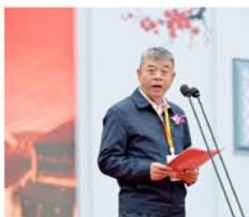
中国酒业协会理事长王延才致辞