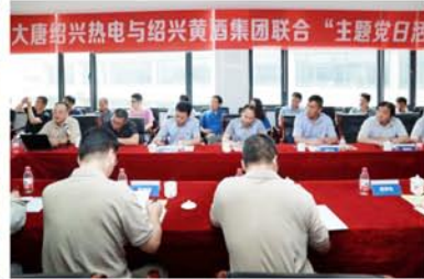
大唐绍兴汽热与绍兴黄酒集团联合“主题党日活”