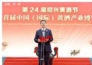
绍兴市委副书记、市长盛冲致辞

据统计，“中国黄酒之都，启航一带一路”第24届绍兴黄酒节暨首届中国(国际)黄酒产业博览会，共156家黄酒及黄酒相关企业参展，邀请国内外嘉宾、经销商1200多人，参观观众2.5万人次，极大地提升了绍兴城市形象和黄酒影响力，彰显绍兴在完成企业重点工作中的独特作用。