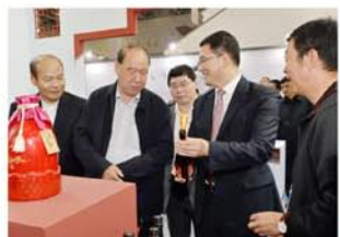
浙江省原领导周国富同志视察博览会绍兴黄酒馆