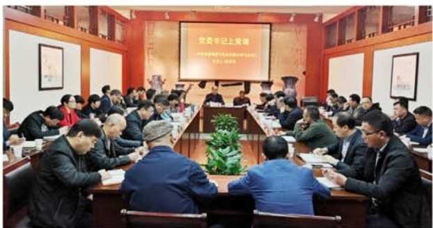
党委书记上党课,党员干部深入学习习近平新时代中国特色社会主义思想

●8月,玻璃瓶厂党总支与各党支部签订“清廉国企”建设责任书,与全体党员签订“三不”廉洁承诺书,在内部管理上推行“阳光工程”,把“清廉国企”建设与生产经营深度融合,生产原材料和重大项目均实现招投标。